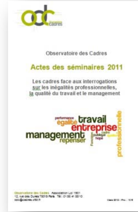
Actes des séminaires 2011