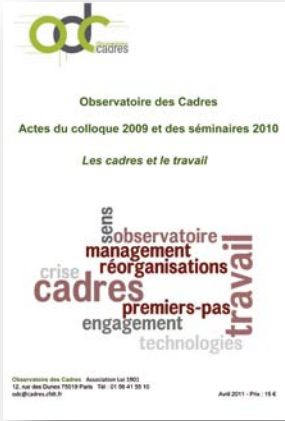
Actes du colloque 2009 et des séminaires 2010